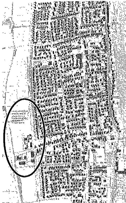
Übersichtslageplan, o. Maßstab